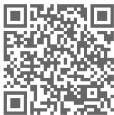
保護者向け障害者就労支援セミナー ホームページ

障害のある方の就労を考える際に、あわせて考えておきたいことが障害年金に関することです。このセミナーでは、障害年金について、事例を交えて分かりやすくご説明いただき、障害年金と就労について考えていきます。また、セミナー終了後は就労に関する相談会を開催しますので、個別に相談されたい方はぜひご活用ください。