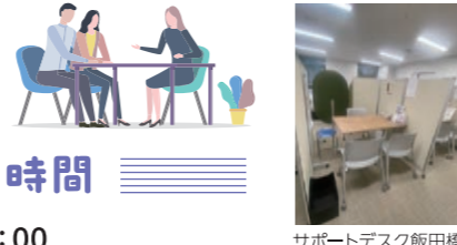
サポートデスク飯田橋

障害者雇用就業サポートデスクでは、障害のある方の就職活動や企業の障害者雇用などの雇用・就業について、それぞれの状況やご希望に応じてご相談いただけます。障害者雇用に関する資料もご覧いただけますので、お気軽にご利用ください。