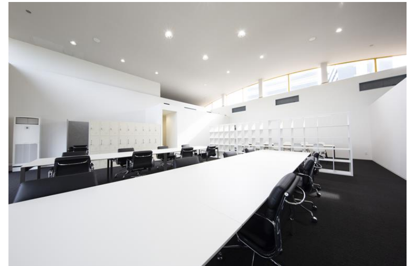
令和4年度行政コース採択施設 「フナイリバ タテモノ」