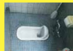
工事前 (元々は男性専用トイレ)

トイレのためにフロア移動することもなくなり、生産効率のアップにもつながっています!