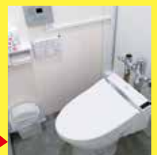
工事後 (女性専用トイレ)

本チラシ記載以外にも要件がございます。申請にあたっては当財団HP掲載の「募集要項」を必ずご確認ください。